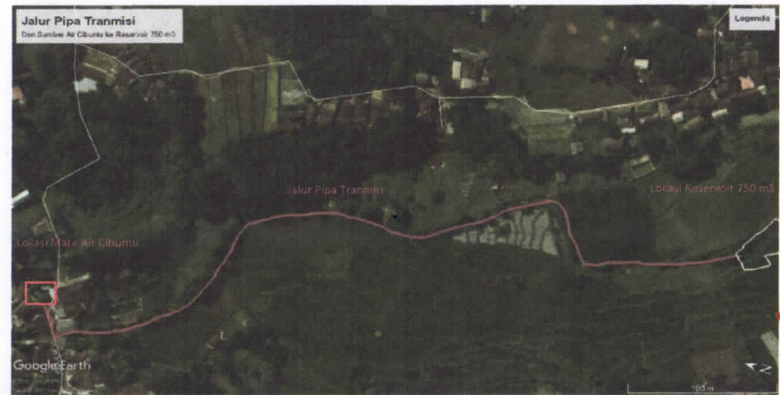
Jalur pipa distribusi Cibadak