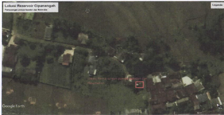
Situas lokasi pemasangan pompa dan flowmeter