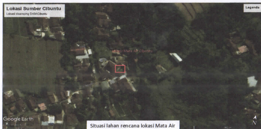
Situasi Lahan