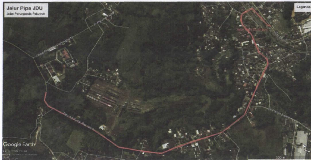
Situas lokasi Jalur Pipa JDU